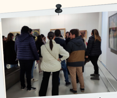
Sortie culturelle au Musée Fabre