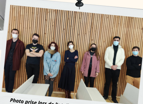
Photo prise lors de l'atelier de mise en voix des textes en lien avec le programme de littérature