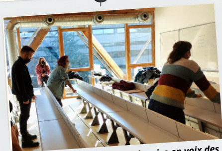
Photo prise lors de l'atelier de mise en voix des textes en lien avec le programme de littérature

« Encadrement, professionnalisme et considération des étudiants en tant qu'adultes. » Méghane