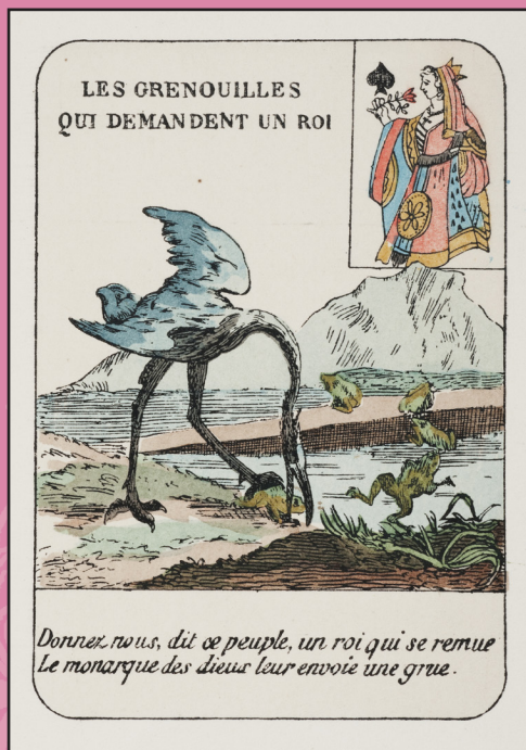
Extrait de Les Cartes à jouer du xiv e au xx e siècle d'Henry-René d'Allemagne, 1906