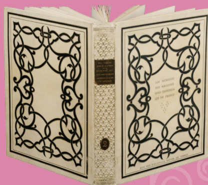
Reliure de l'ouvrage Les Richesses des bibliothèques provinciales de France de Pol Neveux, éditions des Bibliothèques nationales de France, 1932

les documents peuvent être photographiés pour un usage privé mais, par souci de conservation, les photocopies ne sont pas autorisées. Si vous devez diffuser ces reproductions dans le cadre d'un travail universitaire ou d'une publication, veuillez contacter au préalable la responsable du fonds.